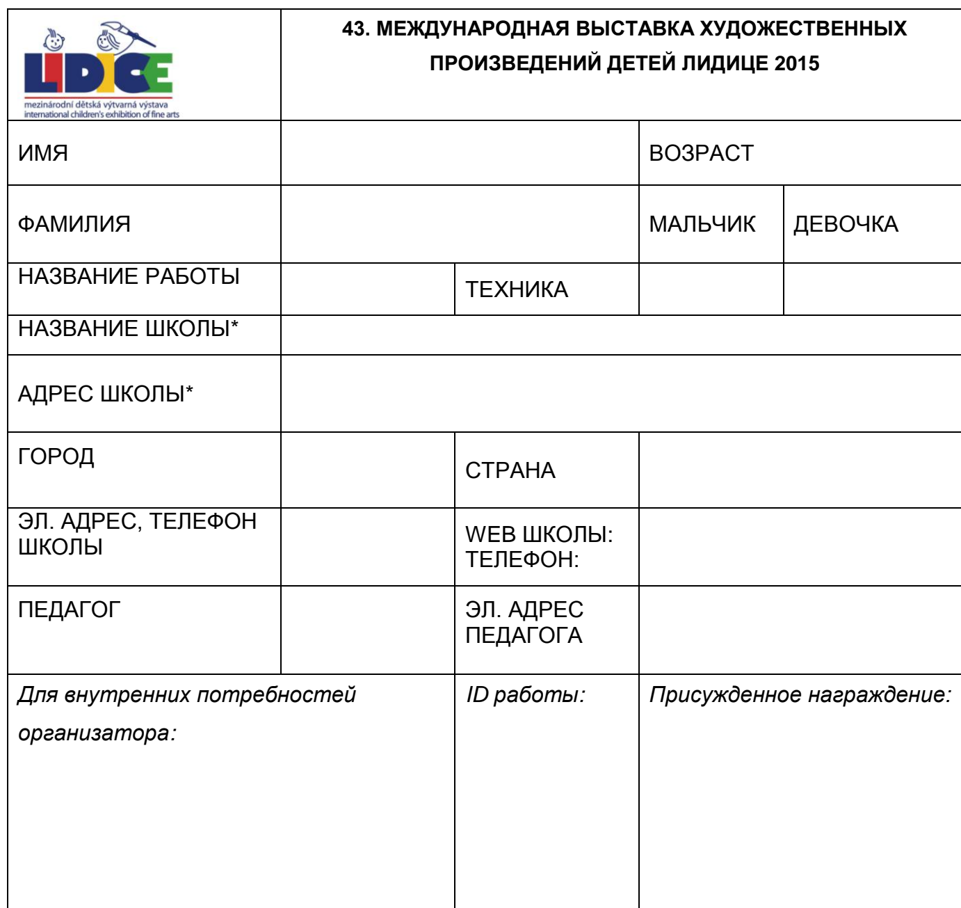
Таблица для маркировки работ

Таблицу прикрепляйте на обратной стороне работы в правом нижнем углу